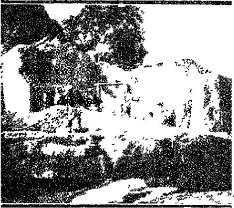
मोतिहारी के कलक्टर का बँगला